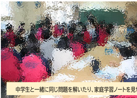
中学生と一緒に同じ問題を解いたり、家庭学習ノートを見せてもらったりしました。

また、6年生は2月に入学説明会がありますが、それとは別に一中の先生による出前授業も計画しています。子どもたちが中学校への不安を少しでも取り除き、中学校でも頑張れるように配慮していきたいと中学校と話し合っている取組の一つです。校舎が隣同士というよさを生かしながら、子どもたちのためにできることを今後も考えていきたいと思っています。