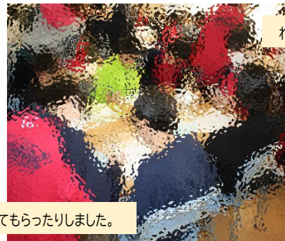
わからないところを、熱心に教えてくれた中学生です。