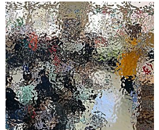
クリスマスバージョンの読み聞かせ ありがとうございます！(12月17日開催)

さて、今年度の冬休みは16日間です。3学期のスタートが10日となりますので、いつもより短い休みにはなりますが、自分で計画したことを実行し、規則正しく充実した休みを過ごしてほしいと思います。また、市内でも感染症が広がりつつあります。冬休み中も、引き続き感染対策と交通安全に気をつけて、健康に過ごしてほしいと思います。