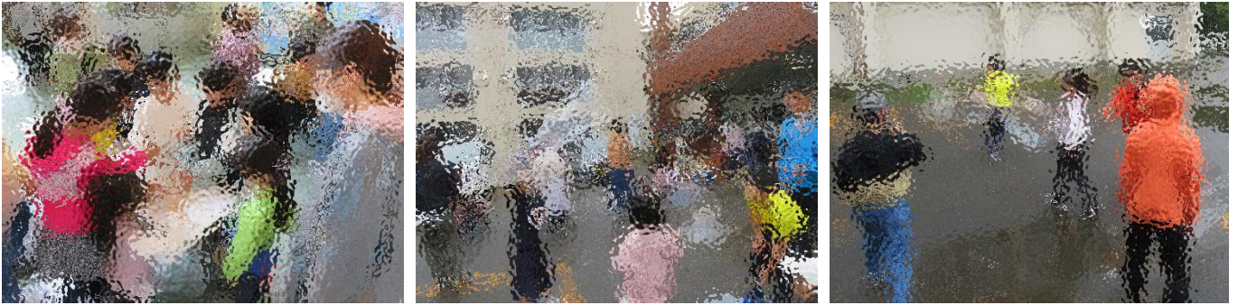
約80名の児童が参加しました。お手伝いいただいた保護者のみなさん。ありがとうございました。

PTA で準備した割れにくいシャボン玉液で、しゃぼん玉を作って楽しみました。とても大きなしゃぼん玉を作ったり、たくさん飛ばして楽しんだり、参加した子どもたちは思い思いに楽しむことができました。啓北きっずとPTA とのコラボ企画で実現しました。保護者、地域の皆さんに感謝です。