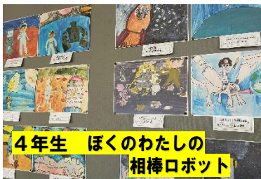
4年生 ぼくのわたしの相棒ロボット

※季節の変わり目で、寒暖差もあり体調を崩す人も出ています。食事と睡眠をしっかりとって、体調管理にご注意願います。