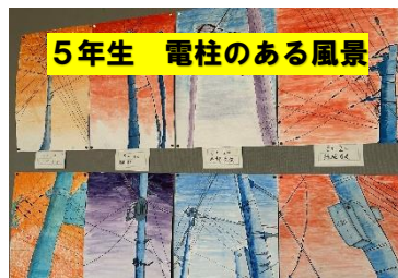
5年生 電柱のある風景