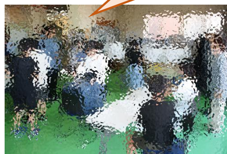
実際の投票会場と同様に、受付をして投票用紙をもらい、選んだ人を書いて投票する流れを全員が体験しました。