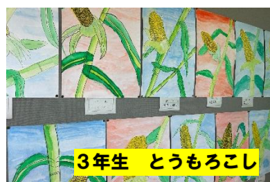
3年生 とうもろこし