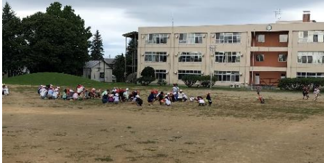
地震が落ち着くまで待機

地震がおきているという放送が流れると、グラウンドで遊んでいた児童が中央に集まり、しゃがんで身を守る体制をとりました。高学年が低学年に教えてあげる様子もあり、大変立派でした！