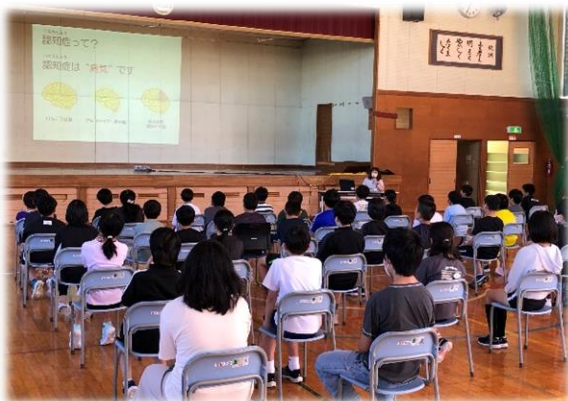
スライドを使ってわかりやすく説明してくださいました。認知症予防の体操も教えてくださいました。

9月6日(金)、5年生の総合的な学習の時間に実施している「おびひろ市民学」において、帯広市役所の高齢者福祉課の方が講師となり、認知症サポーター養成講座がありました。