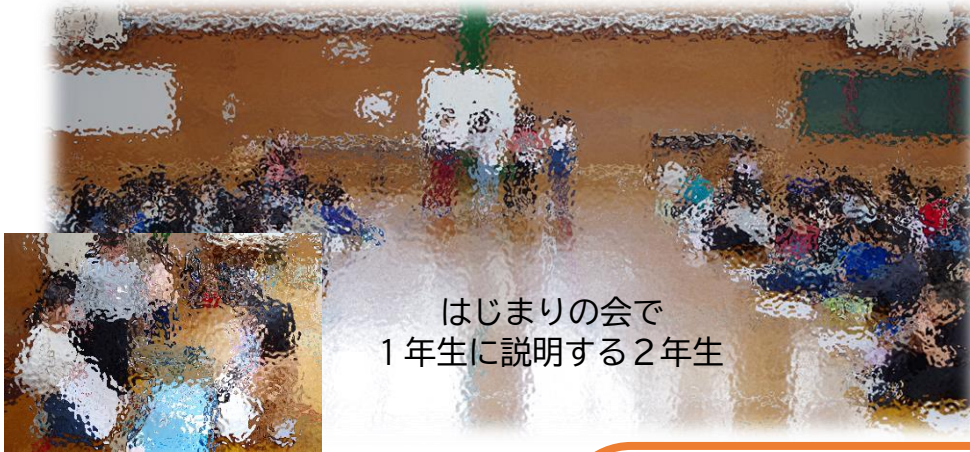
はじまりの会で 1年生に説明する2年生