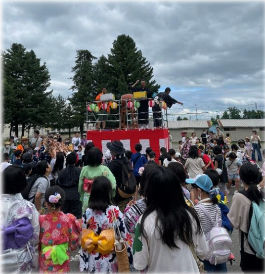
低・中・高学年に分けてのお菓子まきの様子

8月19日(土)13時から「啓北ネットワーク委員会」が企画、運営する「啓北みんなの盆踊り」が開催されました。コロナ禍により開催できずにいましたが、今年は4年ぶりの復活で、スタッフや保護者も合わせると400名近くの人が集まり大盛況でした。